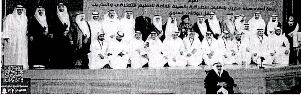
خلال احتفالية "وقفه وفاء 2018" التي نظمتها رابطة أعضاء تدريب "التطبيقي" لتكريم نخب وطنية