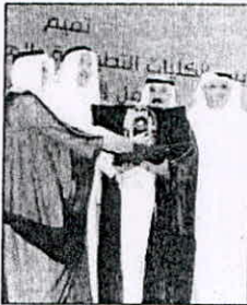
تكريم الفنان جاسم الشهاب