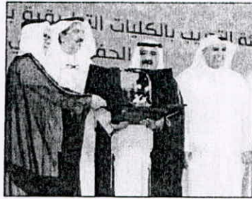
دروع تكريمية للتطور حمود الشف

سنوات، ورغم قلة الإمكانات إلا ان الرابطة استمرت، مؤكدا ان المكرمين هم قصص مختلفة من العطاء والوفاء، وان اختيار تلك النخبة من الرموز الوطنية لتكريمهم جاء نتاج بصماتهم التي علفت