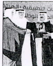
تكريم الفنان ابراهيم دربه